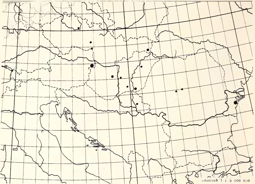
Abb. 1. Die Fundstellen von Odinshühnchen (Heimzug). — Anzahl: • = 1, ● = 2 bis 10, ● = über 10 Ex. — Maßstab 1 : 6 000 000